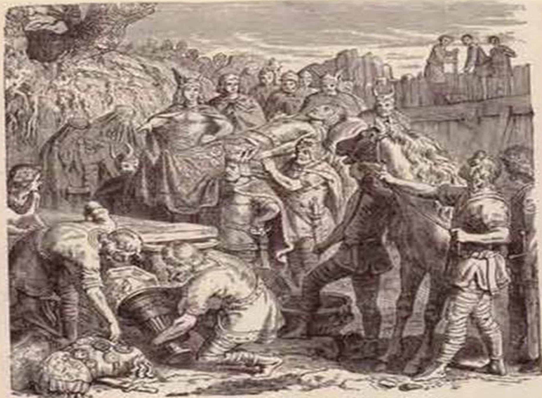
THE BURIAL OF ALARCÓN IS THE END OF THE BUBENTIC'S.