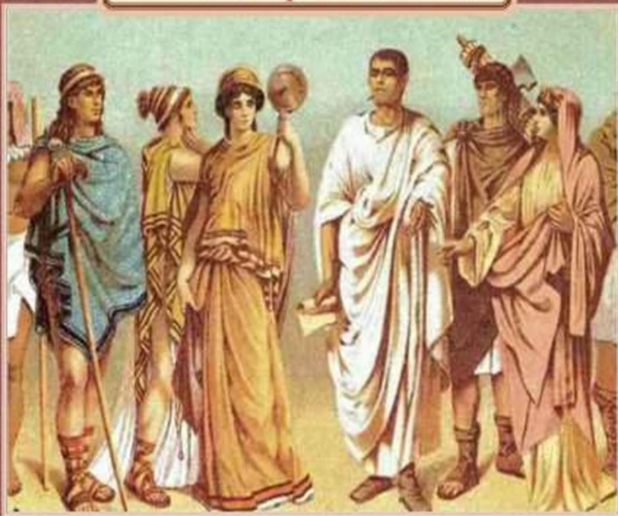
Сцена из представления