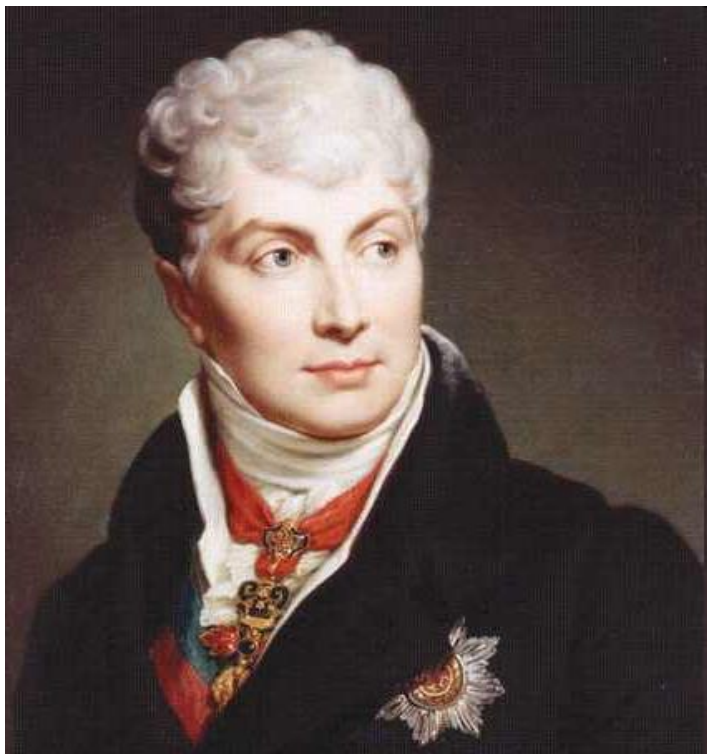
Клемент Венцель Меттерних