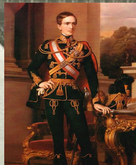
Франц Иосиф I