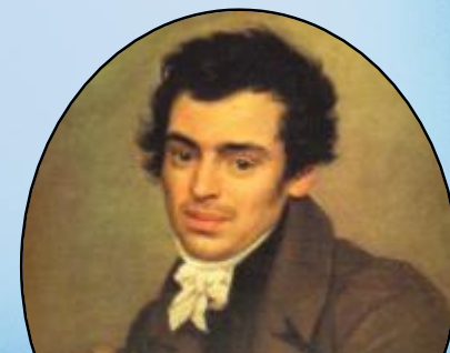
Константин Андреевич Тон