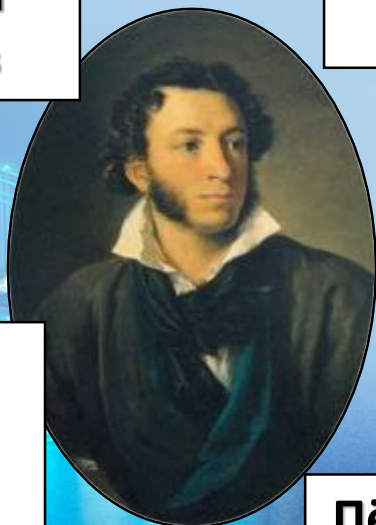
Александр Сергеевич Пушкин