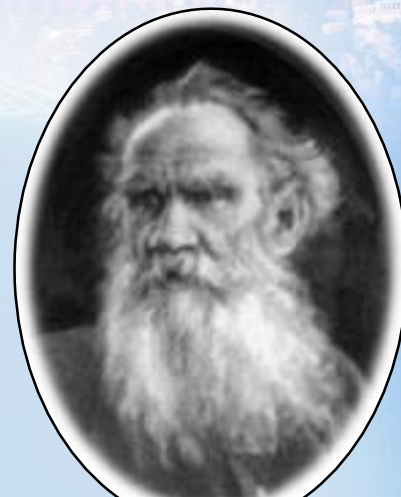
Лев Николаевич Толстой