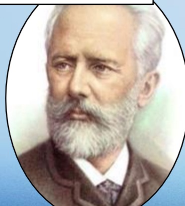
Пётр Ильич Чайковский