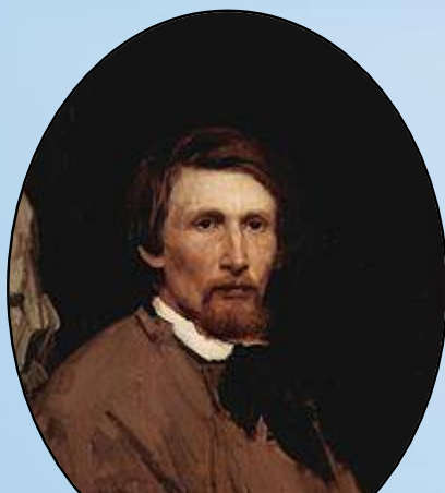
Виктор Михайлович Васнецов